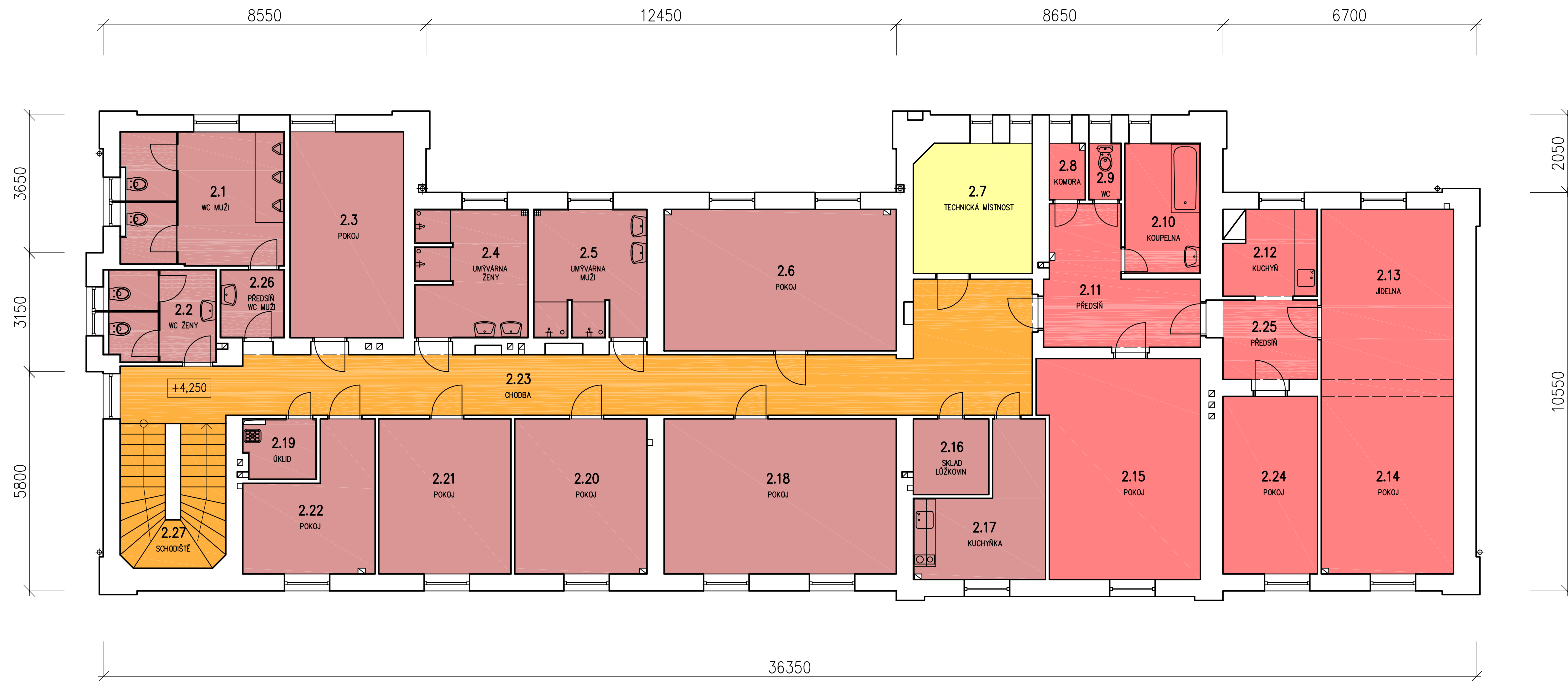
PŮDORYS 2.NP +4,250 (1.PATRO)