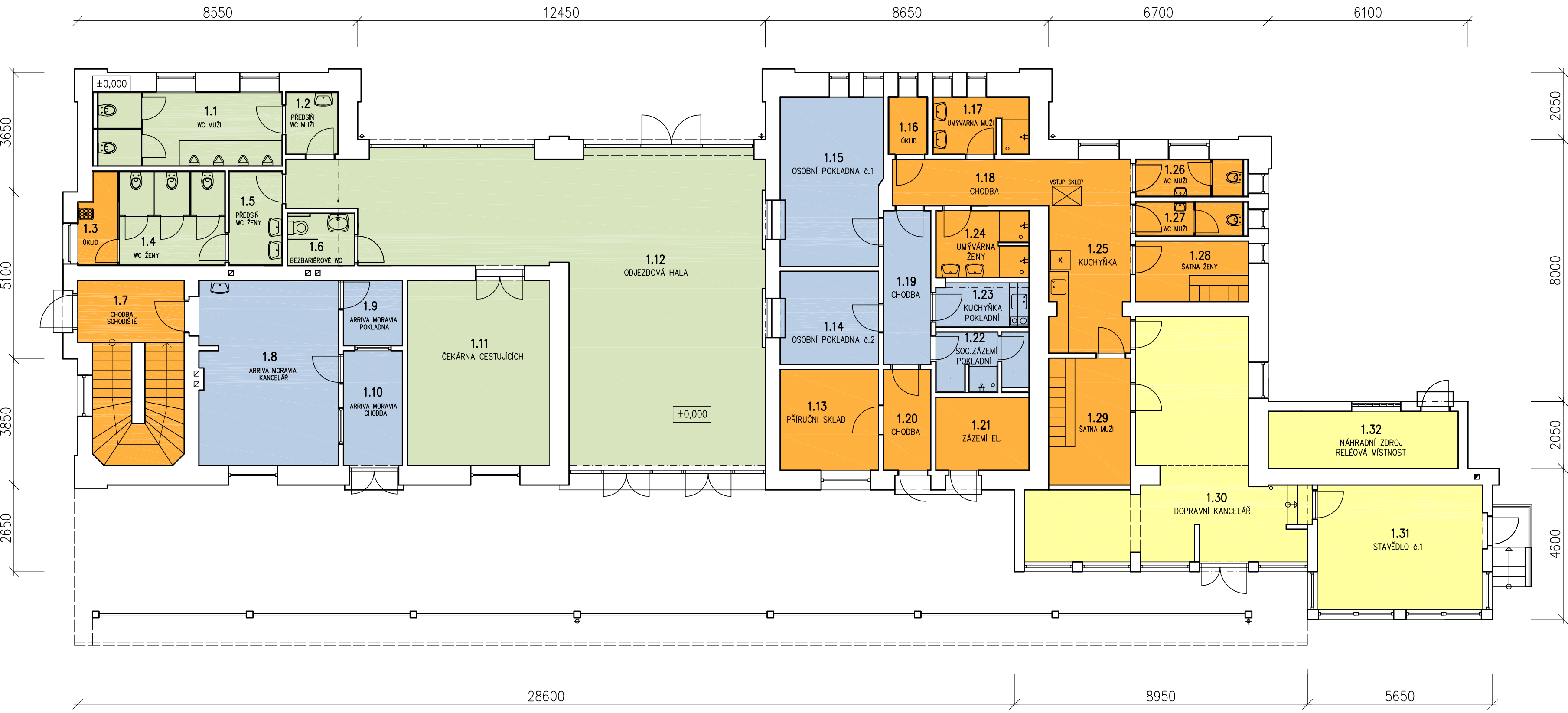
PŮDORYS 1.NP ±0,000 (PŘÍZEMÍ)